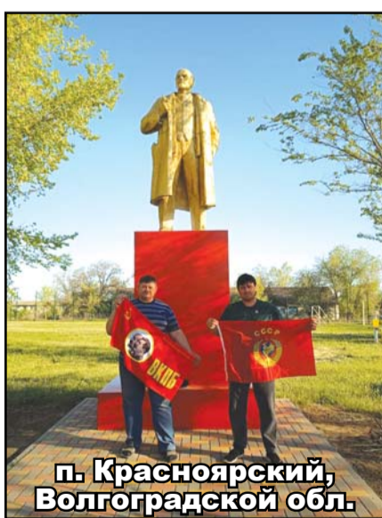
п. Красноярский, Волгоградской обл.