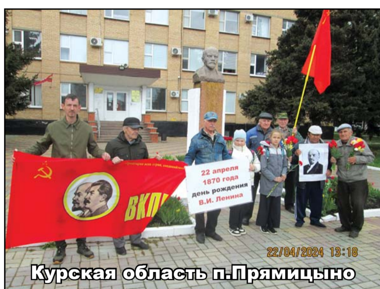
Курская область п.Прямыцыно