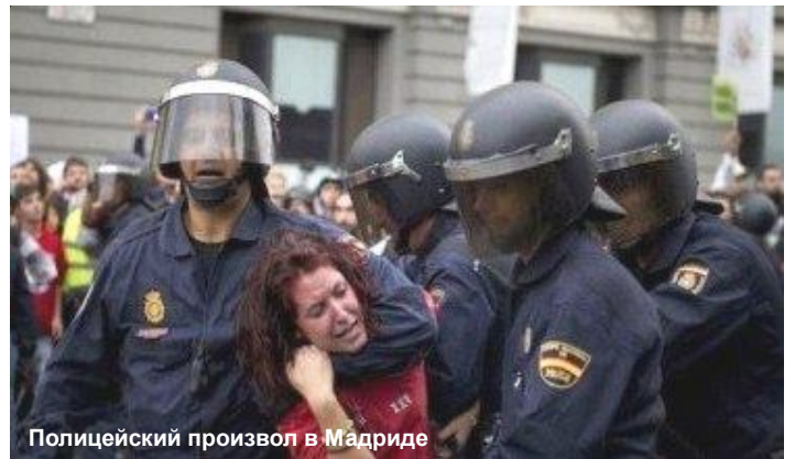
Полицейский произвол в Мадриде

Возможно, впервые классовая ненависть к глобальному капитализму сплелась с религиозной ненавистью к тому же глобализму. Ведь причина этих двух видов ненависти одна и та же – унижение, ограбление и эксплуатация стран мировой Периферии хищным, беспощадным глобальным