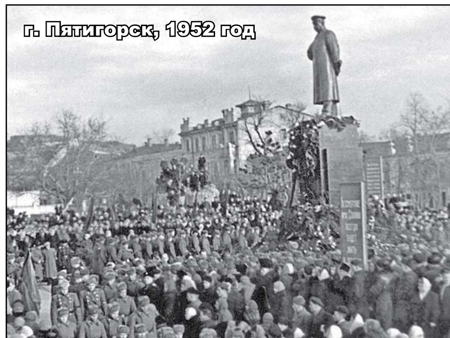
г. Пятигорск, 1952 год