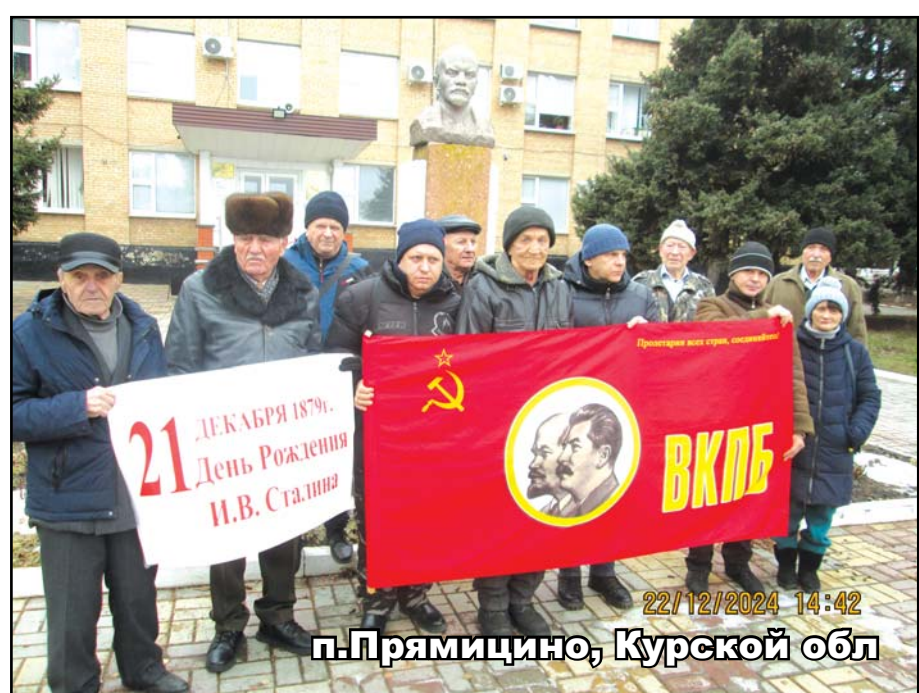
п.Прямицино, Курской обл