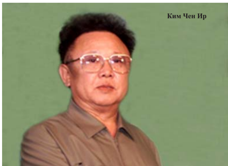
Ким Чен Ир

ской борьбы, верная соратница и друг Великого Вождя Товарища Ким Ир Сена, мать Великого Сына Кореи Товарища КИМ ЧЕН ИРА.