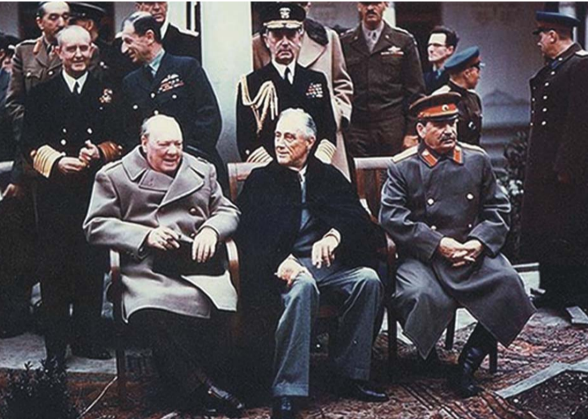
И.В.Сталин на Ялтинской конференции трех держав. 1945

стране мира не церемонятся, иначе нет ни суверенитета, ни территориальной целостности, ни неприкосновенности грани государства. (За период войны 1941-1945 и после, до марта 1953 г. число осужденных за контрреволюционные и особо опасные государственные преступления составило 559909 человек и 379823 человека соответственно.)