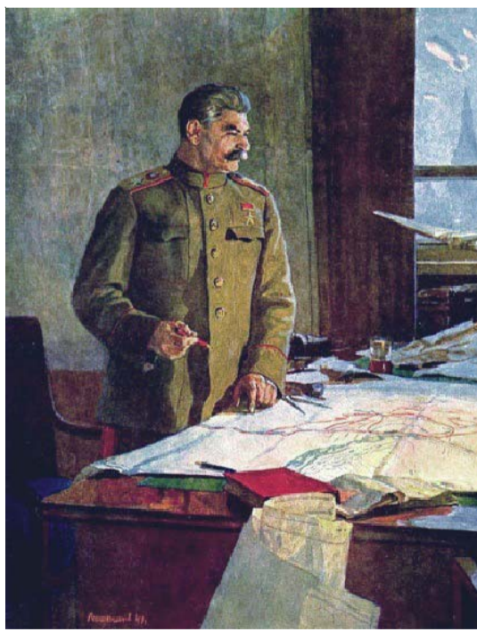
Генералиссимус Советского Союза И.В.Сталин. Художник Ф.Решетников. 1948

Смерть И.В. Сталина (5 марта 1953 г.) прервала стремительное движение нашей страны вперёд – к коммунизму. Пришедшая к власти мелкобуржуазная неотроцкистская группировка Н.С. Хрущёва отказалась от сталинских строго научных и неразрывно связанных с практическими потребностями общества планов перехода к коммунистическому строительству, оклеветала вождя и заложила основы для постепенного сползания нашей стра-