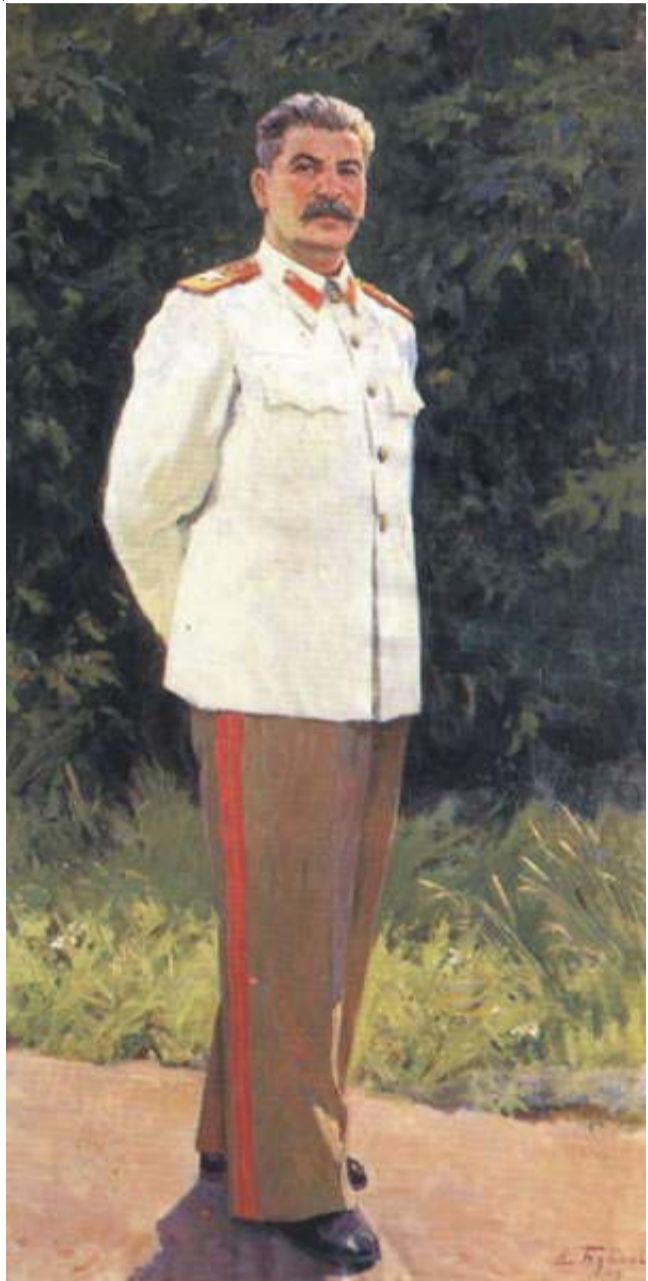
И.В. Сталин. Портрет. Художник А. Бубнов. 1949

рестройки и приведшей к временному поражению социализма, разрушению социалистического лагеря и нашей великой Советской Родины.