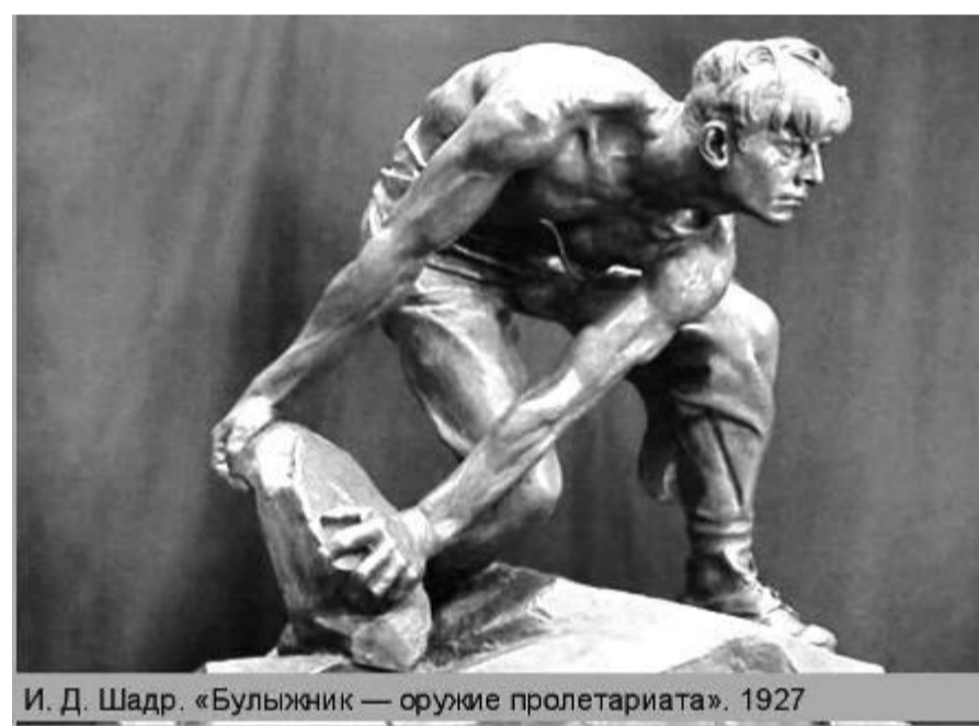
И. Д. Шадр. «Бульжник — оружие пролетариата». 1927

На заседании правительства 25 декабря 2014 года господин Путин оценил работу правительства РФ в истекшем году вполне удовлетворительной и отвечающей требованиям времени. Он сказал: «В целом, считаю работу правительства вполне удовлетворительной, отвечающей требованиям сегодняшнего дня и надеюсь, что так и будет происходить в ближайшее время».