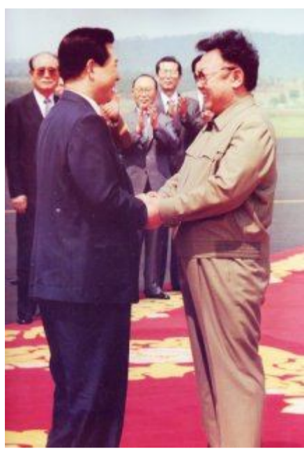
Товарищ Ким Чен Ир встречается в аэропорту Пхеньяна президента РК Ким Дэ Чжуня (июнь 2000 г.)

Путем трудных политических контактов и встреч на высшем уровне Товарищ