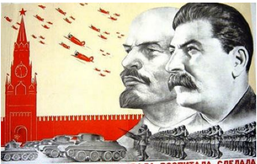
КРАСНУЮ АРМИЮ ОРГАНИЗОВАЛА, ВОСПИТАЛА, СДЕЛАЛА НЕПОБЕДИМОЙ НАША ВЕЛИКАЯ ПАРТИЯ ЛЕНИНА-СТАЛИНА

6 ноября 1943 года в своем докладе по случаю 26-й годовщины Октябрьской революции И.В. Сталин заявил: «...Руководящей и направляющей силой советского народа как в годы мирного строительства, так и в дни войны являлась партия Ленина, партия большевиков. Ни одна партия не имела и не имеет такого авторитета среди народных масс, как наша большевистская партия. И это понятно. Под руководством партии большевиков рабочие, крестьяне и интеллигенция нашей страны завоевали себе свободу и построили социалистическое общество. В дни Отечественной войны партия предстала перед нами, как вдохновитель и организатор всенародной борьбы против фашистских захватчиков. Организаторская работа партии соединила воедино и направила к общей цели все усилия советских людей, подчинив все наши силы и средства делу разгрома врага. За время войны партия еще более сроднилась с народом, еще теснее связалась с широкими массами трудящихся.