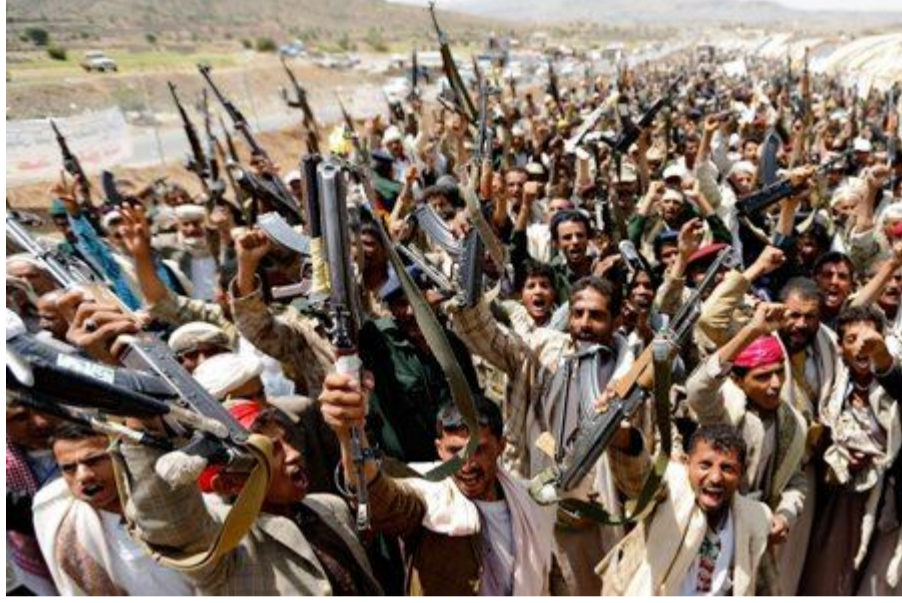
Эр-Рияд – ближневосточный жандарм

Пока всё внимание мирового сообщества приковано к событиям на Украине, где льётся кровь русскоязычного населения, на Аравийском Востоке вспыхнула новая война – на этот раз в Йемене. И главную роль в этой войне играет авиация стран прозападной коалиции, главную роль в которой играет Саудовская Аравия.