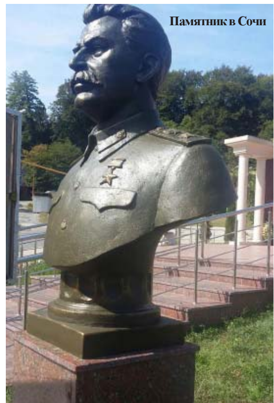
Памятник в Сочи. Стоит отметить, что село Пластуна является самым крупным грузинским поселением на территории России.

Финансирование проекта осуществляется за счёт средств, собранных местным населением, а также часть