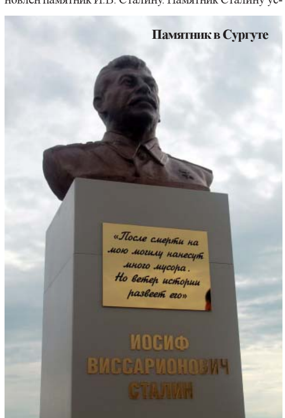
тановлен на народные деньги (сбор средств производился в интернете). На табличке, установленной на постаменте, написано: «После смерти на мою могилу нанесено много мусора. Но безвизиров избираться не позволю».

15 сентября в Сургуте на набережной Оби установлен памятник И.В. Сталину. Памятник Сталину ус-